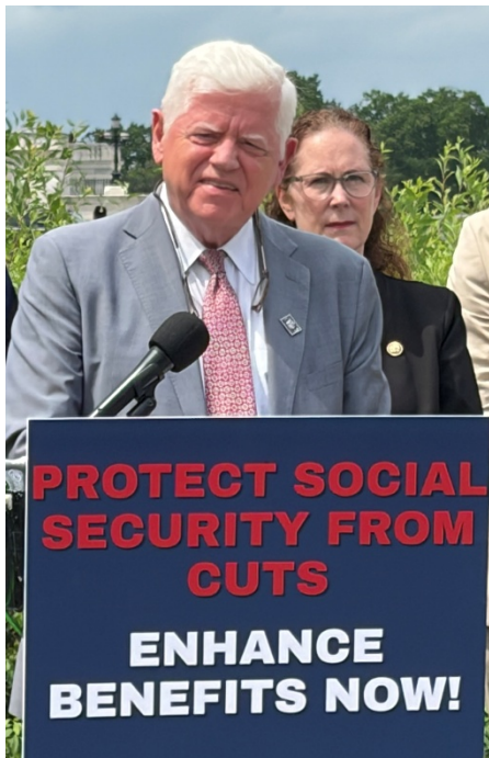
El representante John Larson (CT) habla en la conferencia de prensa del jueves.

Por otra parte, los informes de los fideicomisarios del Seguro Social y de Medicare, dados a conocer el martes, indicaron que el Fondo Fiduciario del Seguro Social quedará agotado en 2032, esto es, un año antes de lo esperado. Se calcula que el Fondo Fiduciario de Medicare permanecerá solvente hasta 2033.