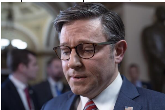
El presidente legislativo Johnson