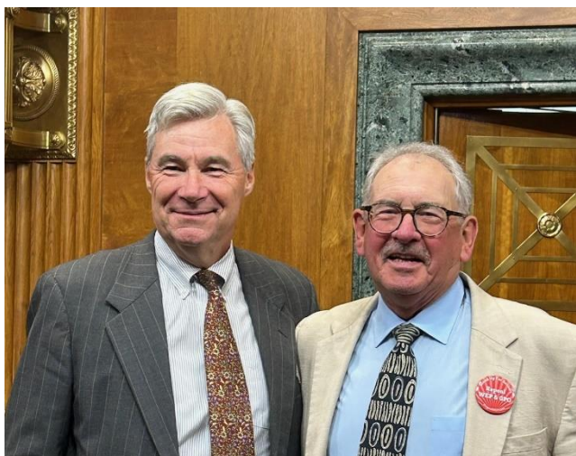
El senador Whitehouse (izq.) con Robert Boudreau.

El presidente Whitehouse ha presentado ante el Senado una legislación para extender la solvencia del Seguro Social. Su proyecto, la Ley de Contribución Justa para Medicare y el Seguro Social (S 1174), extiende indefinidamente la solvencia del Seguro Social al aumentar la contribución de impuestos que destinan a este programa las personas con un ingreso mayor de $400 mil.