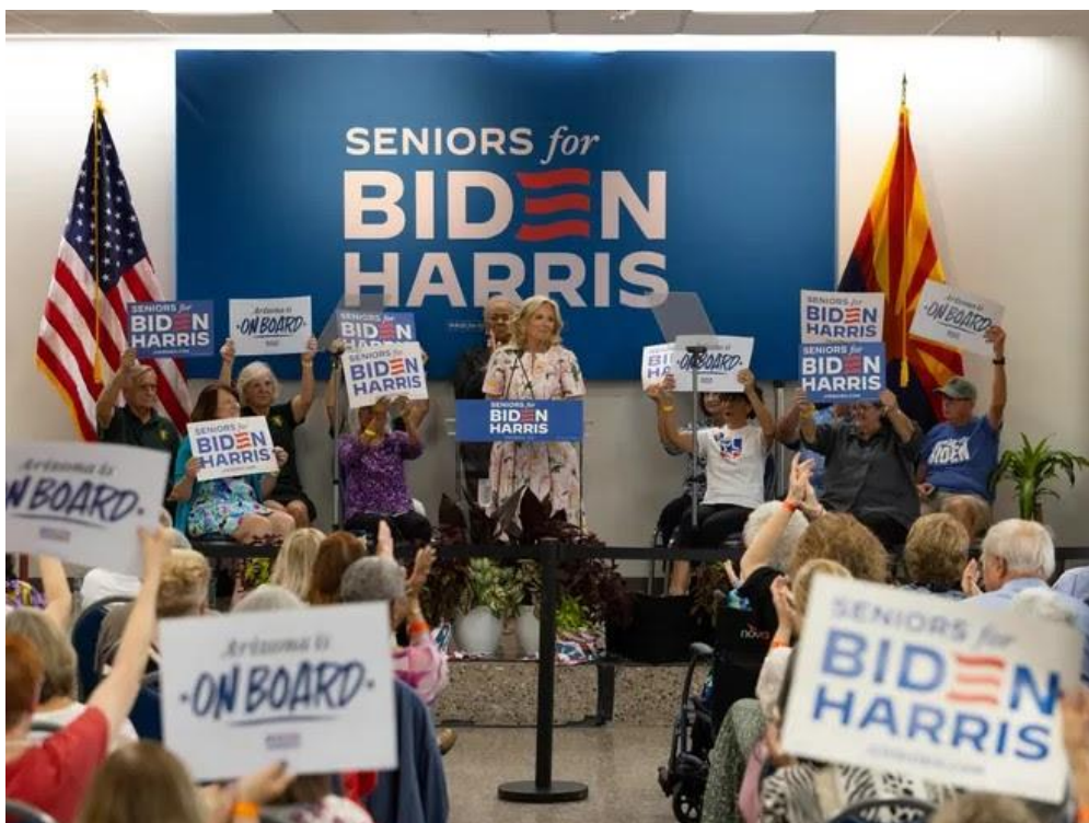
La primera dama, la doctora Jill Biden, con ancianos, en Phoenix.

Muchos miembros de la Alianza de Arizona acompañaron el sábado pasado a la primera dama, dra. Jill Biden , en el centro para ancianos Devonshire de Phoenix. El evento fue el último de varios de la campaña Ancianos por Biden que realizó la doctora Biden hace una semana.