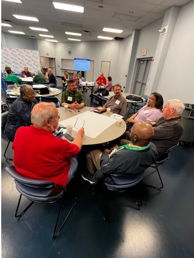
En la asamblea se ofreció un curso interactivo intergeneracional.

precios de sus medicamentos y ampliar al Seguro Social. Además, compartieron sus ideas para incorporar a los trabajadores jóvenes al movimiento de los jubilados.