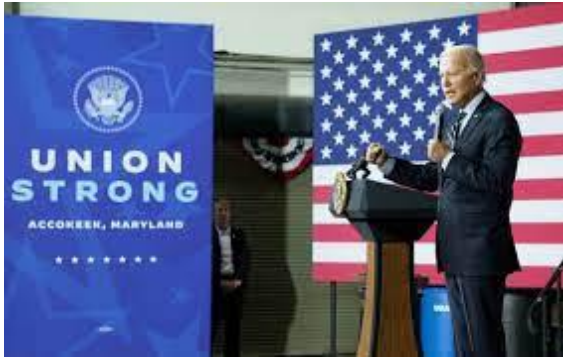
El presidente Biden el miércoles, en Maryland.

“Todos los recortes del GOP en la Cámara de Representantes ni siquiera reducirían el déficit, sino que nada más pagarían más exenciones de impuestos que beneficiarían abrumadoramente a los súper ricos y a las más grandes corporaciones de negocios —expuso el director ejecutivo Fiesta—. El plan del presidente Biden reduciría el déficit casi $3 millones de millones a lo largo de 10 años, al pedirles a los estadounidenses más adinerados y a las grandes corporaciones de negocios que paguen su justa parte, y al reducir el derroche de gastos en intereses especiales, como son los de los grandes consorcios farmacéuticos y petroleros”.