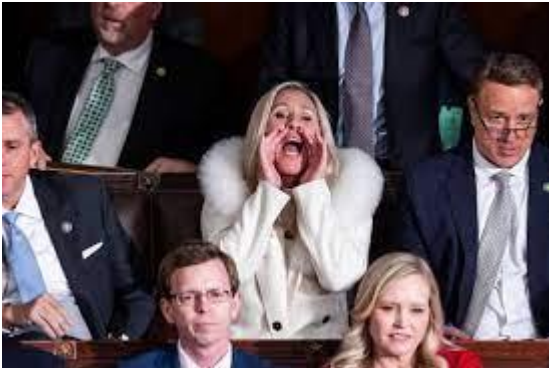
Marjorie Taylor Greene (republicana por GA) gritándole al presidente Biden, el martes.

Muchos republicanos interrumpieron a gritos contra Biden, alegando falsamente que ese no