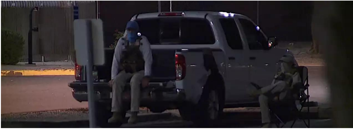
Dos individuos enmascarados, vestidos con equipo de operativo militar, sentados cerca de un buzón electoral en Mesa, Arizona, el 21 de octubre de 2022.