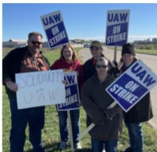
Los miembros de la Alianza de Iowa estuvieron también en las líneas de huelga en John Deere.