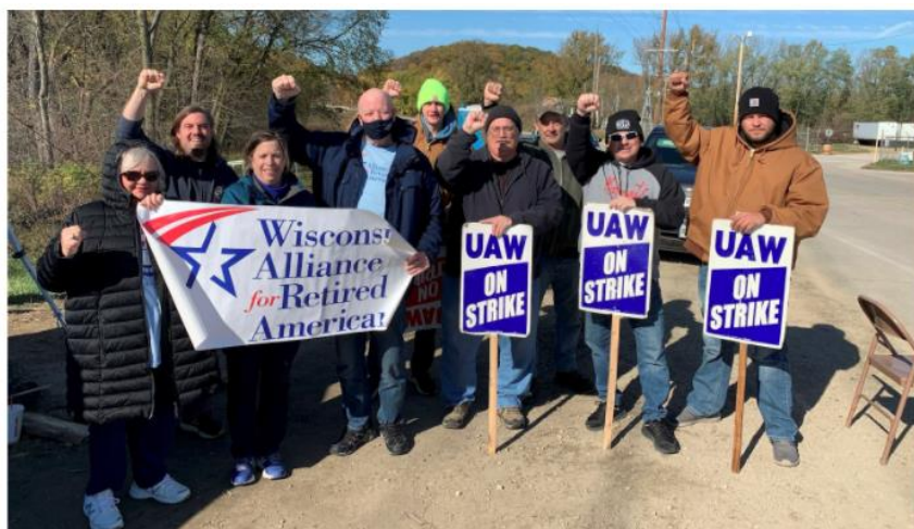
Los miembros de la Alianza de Wisconsin viajaron a Iowa para sumarse a las líneas de huelga en John Deere.