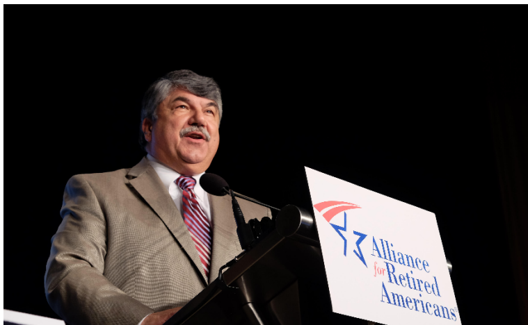
El presidente Trumka en la Conferencia Legislativa de la Alianza celebrada en junio de 2015 en Washington, DC.