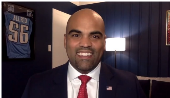
El representante Colin Allred dio un discurso para la Alianza de Texas el pasado miércoles.

En Texas, el miércoles, el representante legislativo Colin Allred mandó un discurso videograbado a un festejo virtual del Seguro Social, Medicare y Medicaid hecho por la Alianza de Texas.