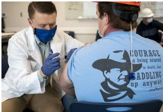
Un farmacéutico pone una vacuna contra la COVID-19 a un trabajador en una planta de procesamiento de la ciudad de Arkansas, Kansas, el 5 de marzo.

Los índices de vacunación de mayores de 65 años en condados urbanos rebasan los rurales en todos los estados para los que hay datos completos, exceptuando siete, según la radio pública nacional . Las más grandes desigualdades están en Nebraska, Massachusetts y Louisiana.