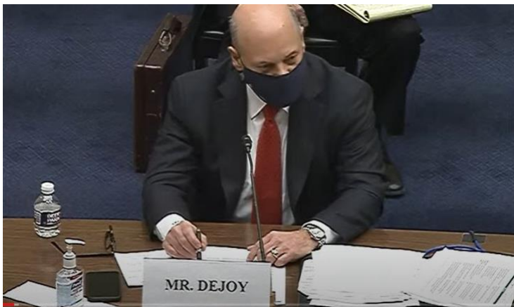
El director general de correos, DeJoy, rinde testimonio en la audiencia del Comité de Supervisión de la Cámara de Representantes, el miércoles.

Asimismo, los miembros del Comité cuestionaron al director general actual, Louis DeJoy , por su llamado “recorte de costos” y sus “estrategias de eficiencia” que han ocasionado un amplio retraso en el servicio. Durante su testimonio, DeJoy les echó la culpa a las “inalcanzables normas de servicio” por los problemas en el correo de primera clase y sugirió que las medidas de bajar las normas y subir los precios continuarán formando parte de su visión estratégica.