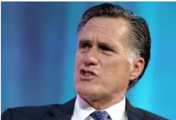
El senador Romney.

Durante el último debate sobre la COVID-19, el Senado emitió 71 votos contra 29 a favor de una enmienda del senador Mitt Romney (UT) que facilita la formación de unos “Comités de Rescate” del Seguro Social y de Medicare. Estos comités tendrían la autoridad para recomendar drásticos cambios al Seguro Social, a Medicare y a los Fondos Fiduciarios Viales, sin límites a lo que puedan proponer, lo cual pone en la mesa de negociación los recortes a las coberturas de los jubilados actuales y futuros.