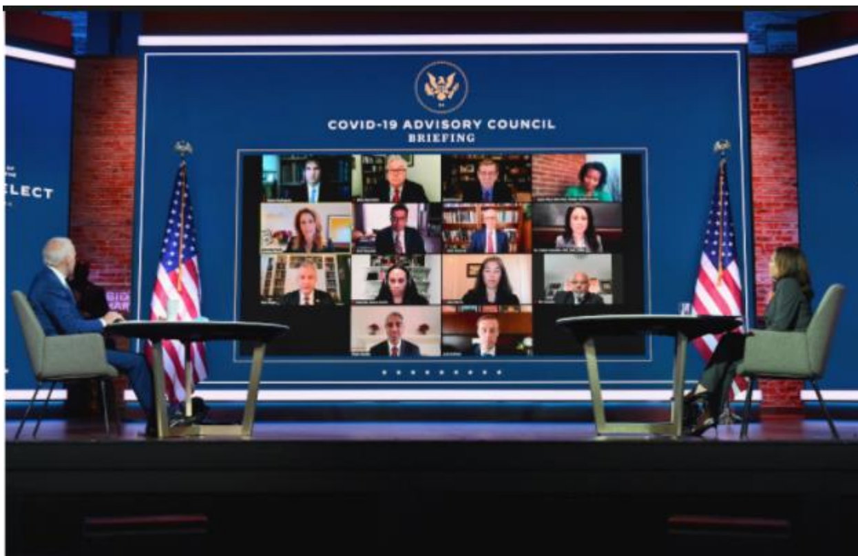
Junta de Asesoría Biden-Harris sobre el COVID-19.

Mientras el presidente electo Joe Biden avanza con los planes de transición gubernamental, el presidente Donald Trump sigue negándose a aceptar que perdió las elecciones . Los líderes de la Junta de Asesoría sobre Coronavirus de Biden están pidiendo a Trump que comparta lo antes posible con el equipo de transición de Biden datos de crucial importancia sobre el COVID-19. Ellos y otros expertos en salud pública subrayan que el retraso del Gobierno Federal para comenzar la transición perjudicará los esfuerzos para manejar y poner fin a la crisis de la pandemia.