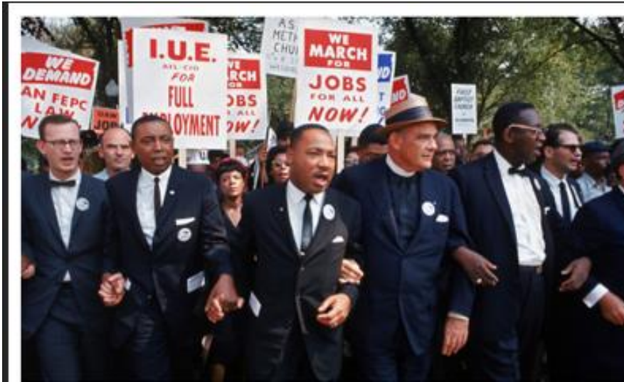
La Marcha en Washington por Empleos y Libertad, 28 de agosto de 1963.

Él creía que una coalición conformada por afroestadounidenses y el movimiento sindical podría tener el más grande impacto positivo, y advertía que los enemigos de la justicia racial eran, frecuentemente, los enemigos de las organizaciones sindicales. El Dr. King denunció las leyes llamadas “del derecho a trabajar” como una patraña, explicando que tales leyes le robaban a la gente sus derechos civiles y sus derechos laborales. Él creía en el poder de los