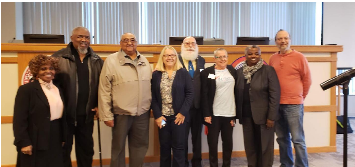
Los miembros electos y reelectos de la Mesa Directiva de la Alianza de Maryland/DC se reunieron el sábado pasado.