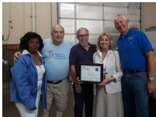
Foto izq.: La representante Johnson se suma a los miembros de la Alianza de Texas para celebrar el aniversario de Medicare y del Seguro Social. Foto der.: La representante Titus acepta el Premio al Héroe de parte de los miembros de la Alianza de Nevada.

Asimismo, varias alianzas locales entregaron a cinco congresistas los premios al Héroe del Jubilado 2018, en reconocimiento a su calificación del 100% de votos a favor del jubilado en el Registro Anual de Votaciones del Congreso hecho por la Alianza. Los galardonados esta vez fueron los senadores Sheldon Whitehouse (RI) y Jack Reed (RI), y los representantes G.K. Butterfield (NC), David Cicilline (RI), James Clyburn (SC), Eddie Bernice Johnson (TX), Jim Langevin (RI), Ed Perlmutter (CO) y Dina Titus (NV).