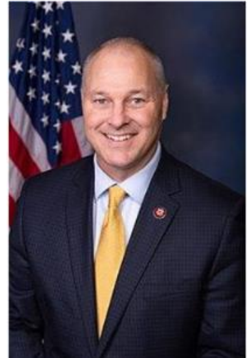
El representante Pete Stauber (MN) hizo campaña a favor de que Medicare negocie, pero una vez electo, revirtió su postura.