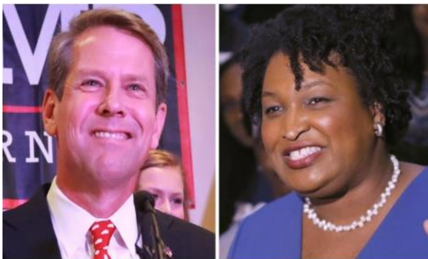
Brian Kemp y Stacey Adams

Kemp se refería en tales comentarios a los esfuerzos de campaña que hace su opositora demócrata, Stacey Abrams , por aumentar la participación de los votantes. Kemp dijo que hacer esos esfuerzos y centrarse en las papeletas de voto ausente “continúan siendo motivo de preocupación para nosotros, especialmente si todo el mundo usa y ejerce su derecho al voto”.