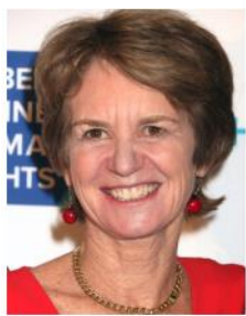
Kathleen Kennedy Townsend