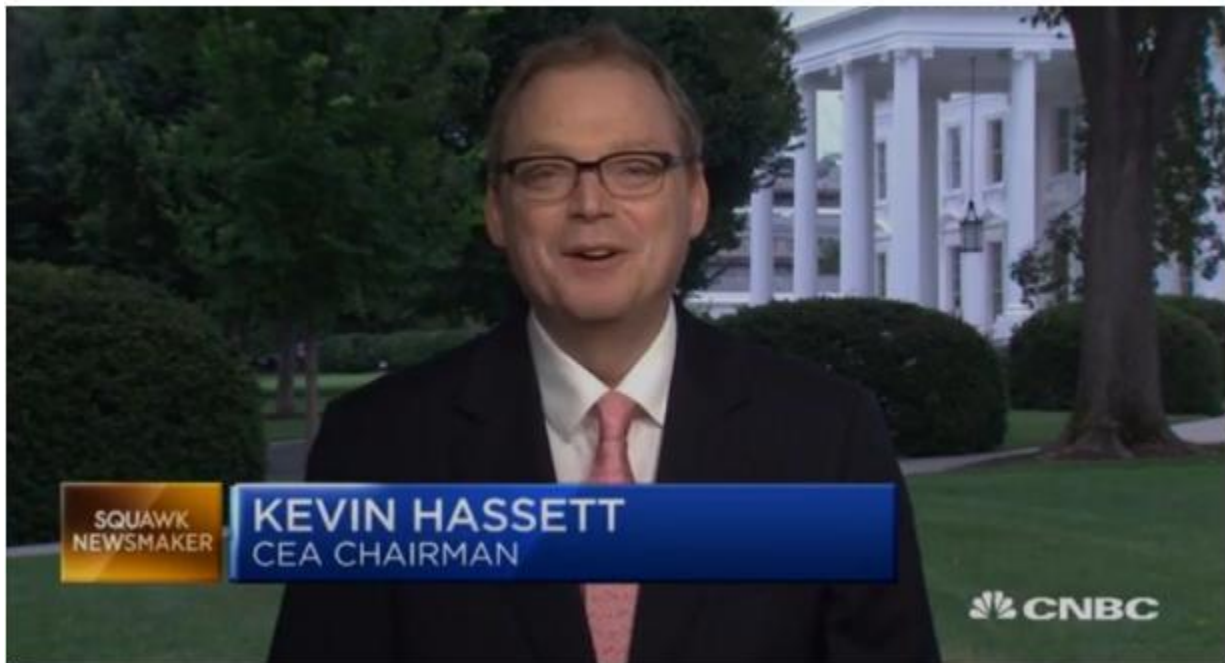
Kevin Hassett habla durante una entrevista para el programa Squawk Newsmaker de CNBC.

La entrevista subrayó las promesas ya rotas del Presidente de que jamás haría recortes al Seguro Social y a Medicare, pero Hassett declaró que al final de las cuentas deberán reducirse programas de coberturas para mantener al déficit bajo control: “la cuestión es en qué punto lo haces sobre los [planes de] derechos ganados, y en un horizonte a más de un 20 o 30 años tienes que hacerlo, entonces mi conjetura es que la conversación se retoma”.