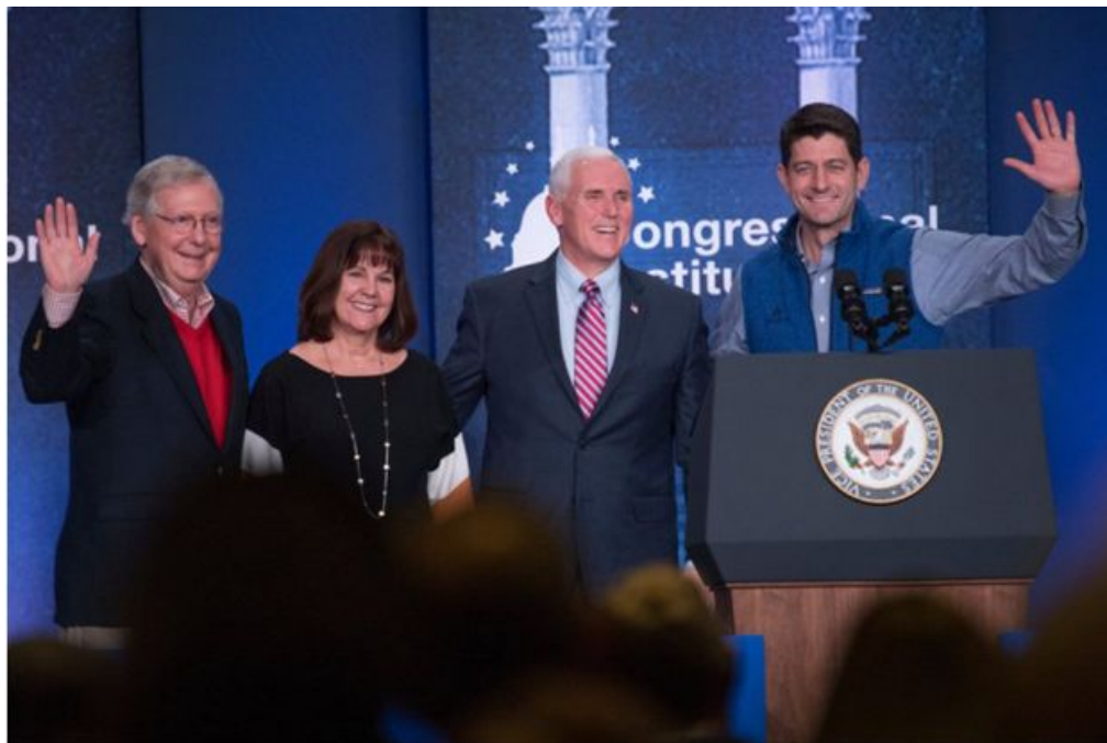
De izq. a der.: el líder de la Mayoría del Senado, Mitch McConnell; Karen Pence; el vicepresidente Mike Pence y el presidente de la Cám. de Rep. Paul Ryan, en el retiro de trabajo del GOP el miércoles pasado, en White Sulphur Springs, W. Virg.

Varios bufetes de abogados enfocados en el interés público están representando a 15 residentes de bajos ingresos de Kentucky que están demandando al gobierno de los Estados Unidos por la reciente medida de la administración de Trump de permitir que los estados impongan requisitos de trabajo a algunos beneficiarios inscritos en Medicaid. Los litigantes alegan que cualquier cambio a Medicaid requiere la aprobación del Congreso.