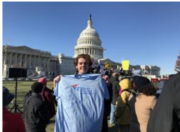
Los protestantes levantaron un letrero sobre Medicare “en venta” y una playera de la Alianza.

Los organizadores llamaron al Senado a retrasar el voto final hasta que tome su asiento el senador electo de Alabama Doug Jones, coreando: “Sin Jones, no hay voto”. Los acompañaron la líder demócrata de los representantes Nancy Pelosi , el senador Bernie Sanders (VT), la senadora Elizabeth Warren (MA), el senador Ron Wyden (OR) y muchos otros. “Es inmoral, está mal, y debe ser derrotado esto”, puntualizó Pelosi.