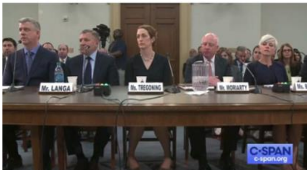
Los testigos en la audiencia de la Cámara de Representantes, el miércoles.

“Los PBM están pagando un conjunto de precios a las farmacias por una medicina en particular, pero después voltean y le cobran a Medicaid y a otros contribuyentes de atención médica más por ese mismo medicamento”, indicó el senador Wyden en su discurso de apertura.